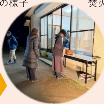
おみくじやお札も販売しました