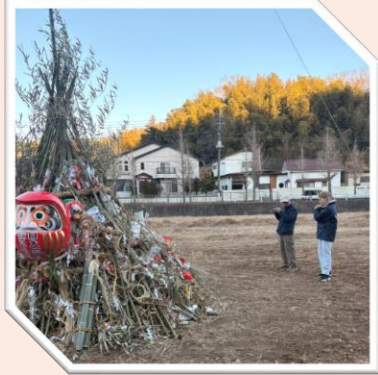
きよめの笛の様子

2026年1月12日(月曜日)16時から、正月飾りをお焚き上げする「だんご焼き」が行われました。当日は、無病息災、家内安全や五穀豊穡などを祈りながら、お焚き上げで焼いたお団子をみんなでいただきました。