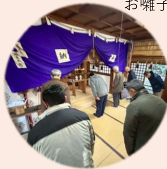
初顔合わせの様子